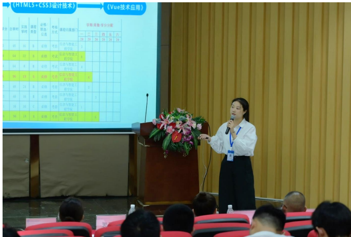
图 4-5 第六届教师说课比赛