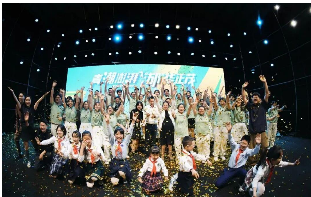
图 3-5 2025 年“青潮澎湃 ‘郝’华正茂”文艺晚会