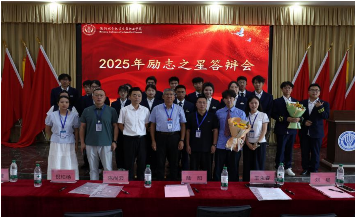
图 3-7 2025 年励志之星答辩会