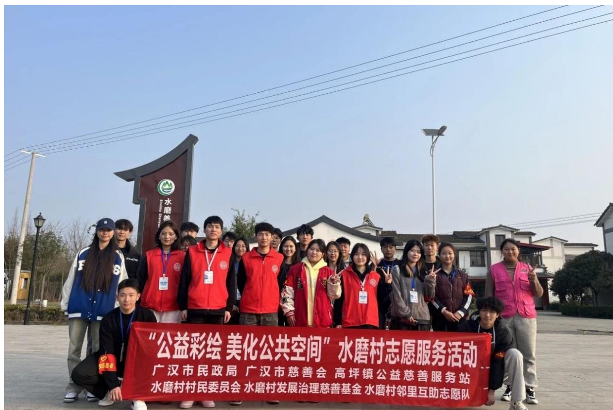
图 7-7 “公益彩绘 美化公共空间”志愿服务活动

此次活动由广汉市民政局、广汉市慈善会等单位共同指导，水磨村村委会大力支持。德阳城市轨道交通职业学院志愿者们用艺术的力量，改善了水磨村的公共环境，提升了乡村的文化氛围，也增强了村民对文明风尚的认知。同时，同学们在实践中锻炼了自身能力，体会到奉献的快乐。未来，我校志愿者们还将继续参与乡村建设，用实际行动诠释新时代青年的责任与担当，为乡村振兴贡献青春力量。