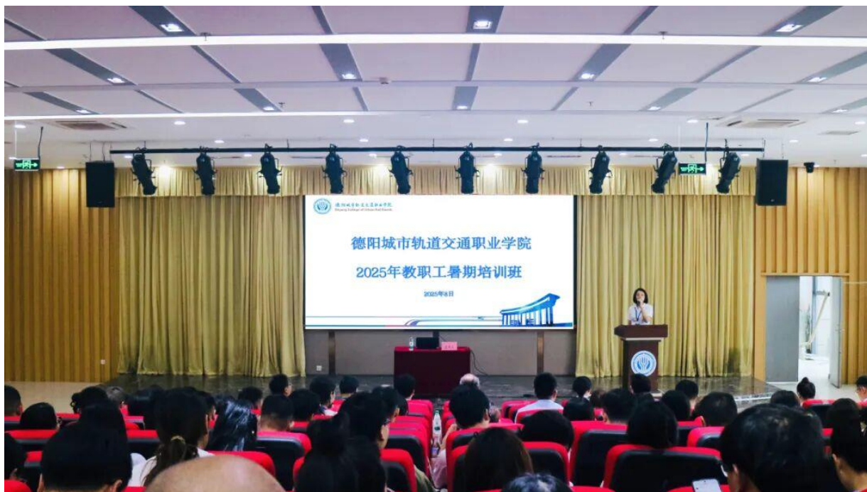
图 4-3 学校开展 2025 年教职工暑假培训

为期一周的教职工暑期培训班。本次培训采用分类、分层、分岗的形式组织实施，将全体教职工划分为新入职教职工、专任教师、学工人员、行政人员、管理干部五个班次，培训覆盖面广、内容充实、形式多样，取得了显著成效。