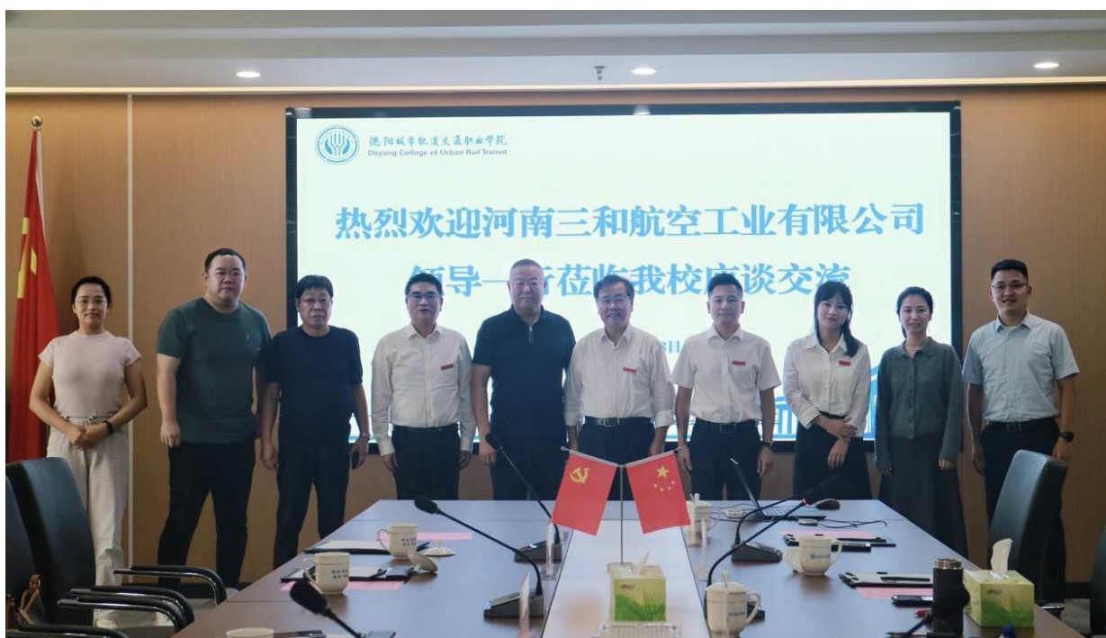
图 8-2 与河南三和航空工业有限公司举行战略合作协议签约暨授牌仪式