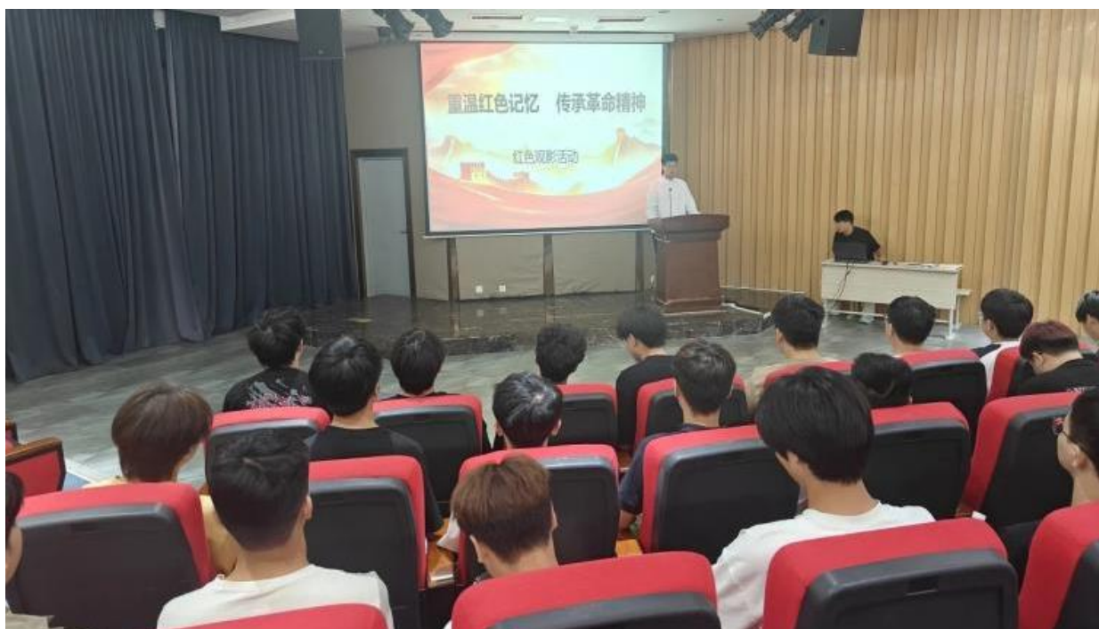
图 7-4 红色观影主题活动