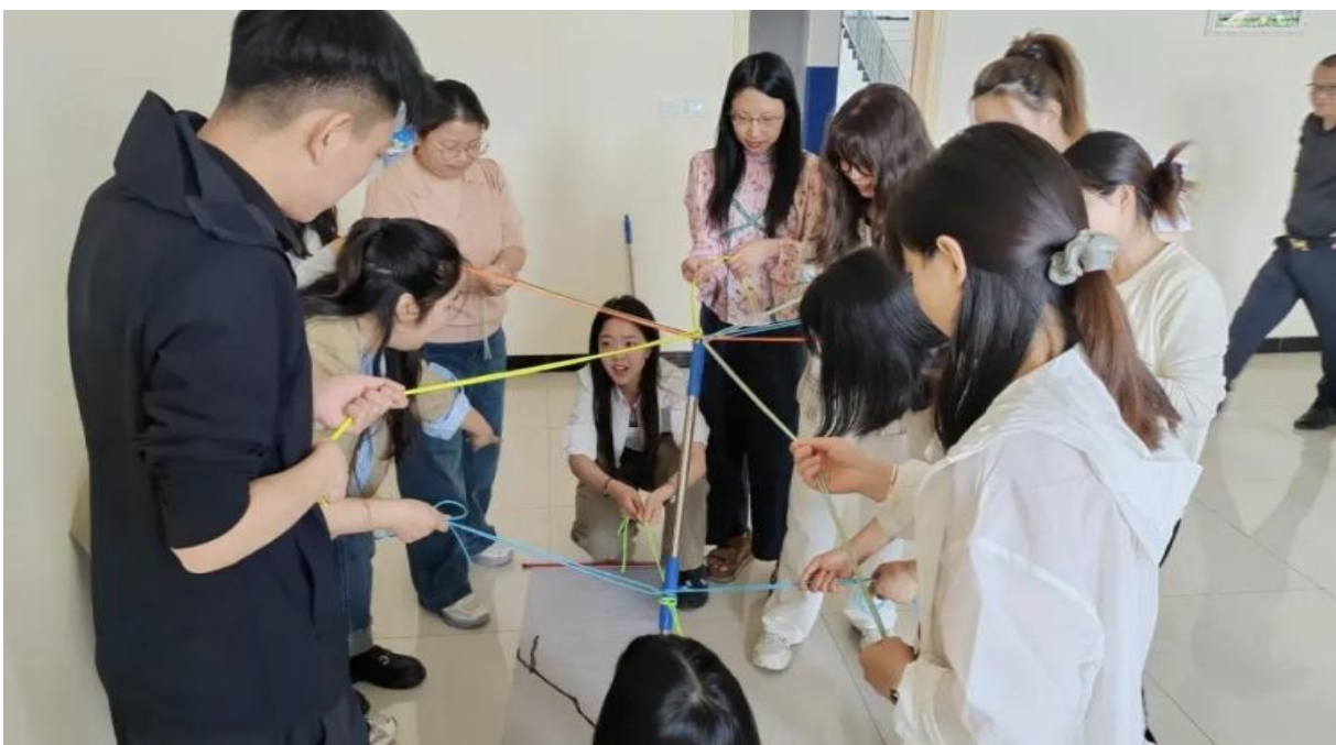
图 3-2 开展团体心理辅导