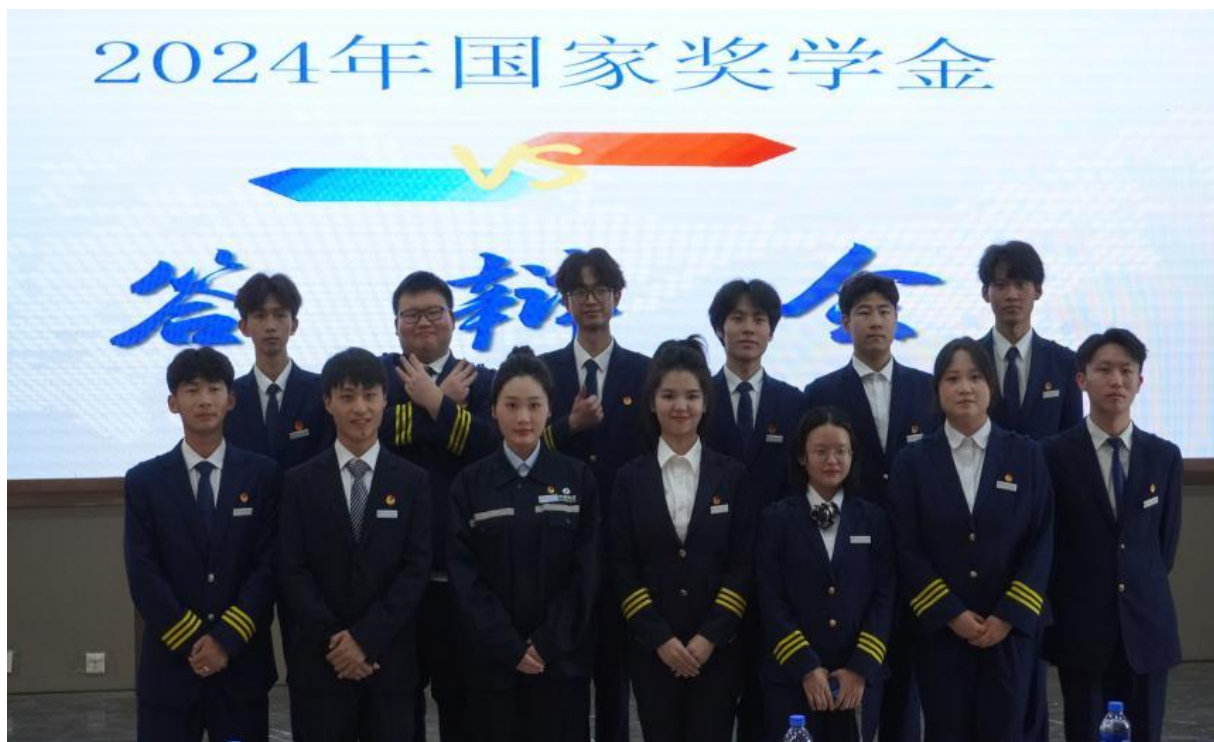
图 3-6 2024 年国家奖学金答辩会

“精准”核心，线上依托官微、官网及时推送高校资助政策体系及细则，线下开展“红心向党·助燃青春”资助政策宣讲会，由学生资助科老师系统解读国、校两级政策；依据相关认定管理办法，通过学生个人陈述、班级民主评议、辅导员谈心谈话“三位一体”模式精准识别困难学生，针对不同困难程度实施差异化资助，坚决保障无学生因贫失学；精神激励侧重榜样引领，通过“红心向党·助燃青春”系列活动中的“励志之星”答辩会发掘自立自强的优秀典型，依托“助燃青春”线上平台宣传其成长经历与学习经验，同步开展线下交流会实现线上线下联动；借助年度国家奖学金答辩会打造校园“励志明星”，树立可感可学的榜样，营造勤学善思、自强奋进的优良学风；德育浸润围绕立德树人根本任务，以“红心向党·助燃青春”为主题，开展主题班会、征文、资助政策宣讲视频比赛等系列活动，引导学生将社会主义核心价值观内化于心；能力提升方面借助勤工助学平台，为困难学生提供实践锻炼机会，缓解经济压力的同时助力其学会自立自强，以劳育人促进综合素质全面提升。