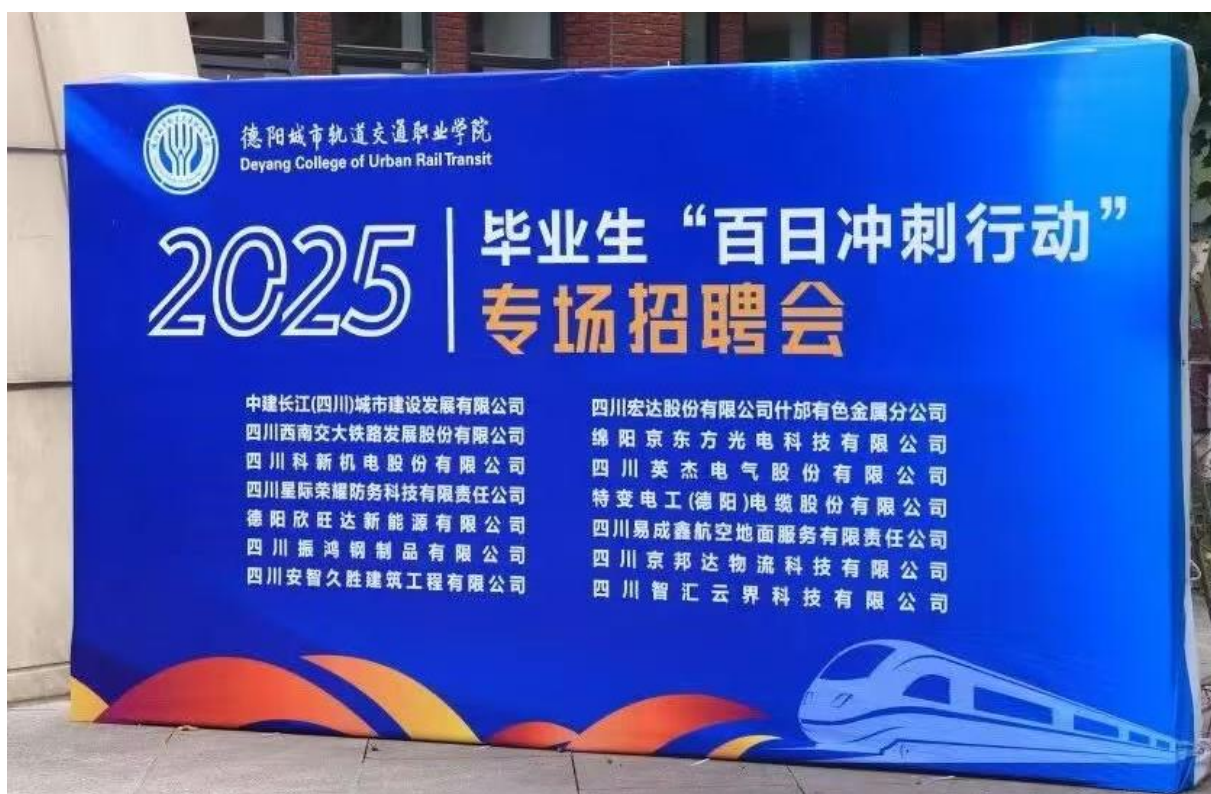
图 3-11 2025 年毕业生校园招聘会