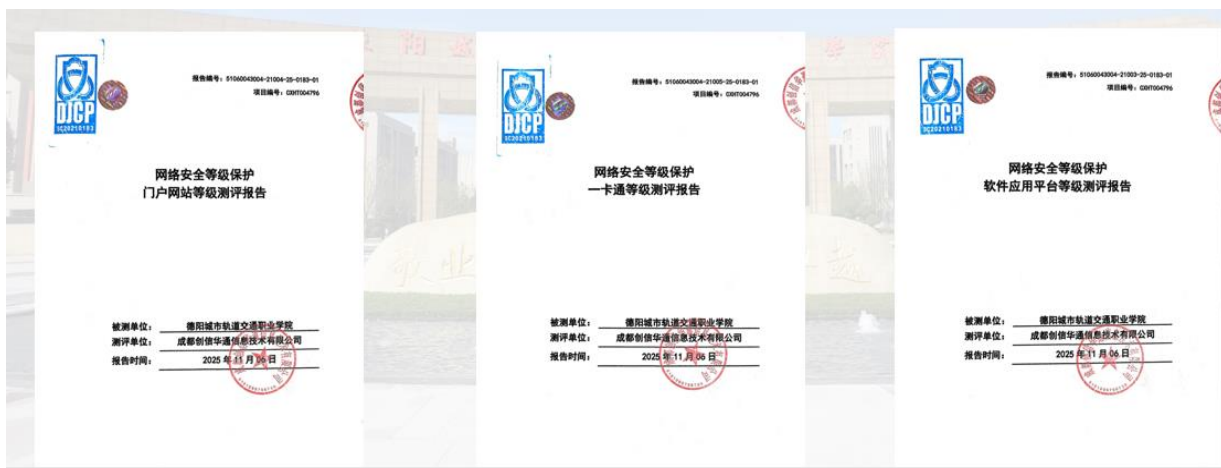
图 1-1 学校开展网络安全等级保护测评