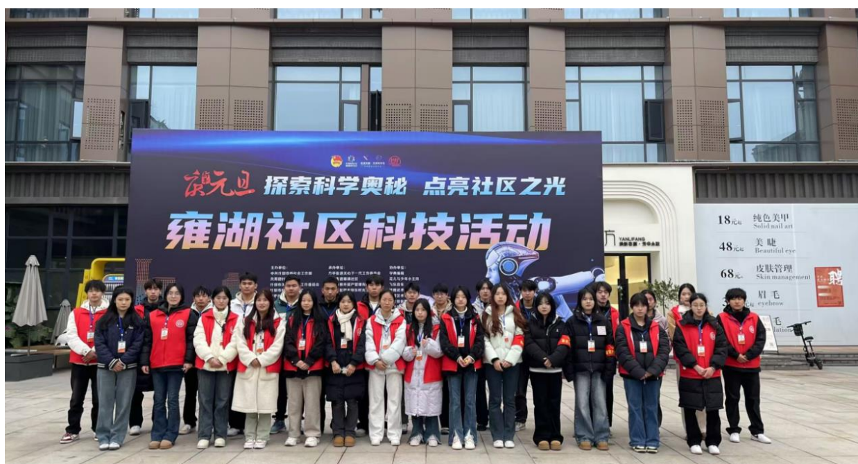
图 7-6 “探索科学奥秘，点亮社区之光”

活动前， 我校志愿者们提前到场对活动的准备工作提供了巨大的力量和帮助，并得到了社区负责人的表扬与赞赏。这不仅仅是志愿者们对志愿活动的热情，也体现了志愿者们对待志愿服务的责任心。再一次彰显了我校学子的优良品质与吃苦耐劳的精神。此次活动不仅让志愿者们进一步了解科技的相关内容，也促进了他们对科技奥秘的理解。我校青志联将继续积极响应社区的号召，共同开展形式多样的志愿活动，在提高社区服务水平的同时培养我校学子的志愿服务精神。