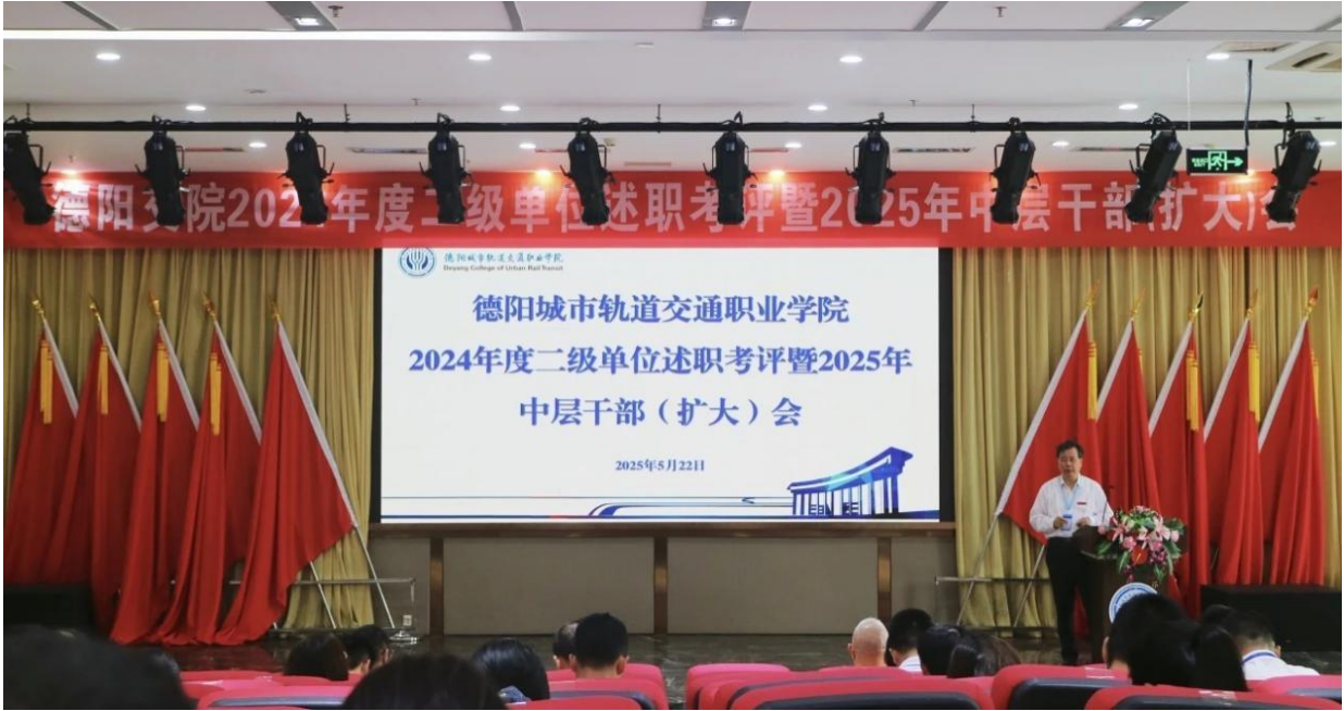
图 4-6 学校开展 2024 年度二级单位述职考评会

工作中；四是持续强化团队建设，鼓励教师注重自身发展，通过引育并举，聘任 27 人担任教研室负责人，33 人担任专业负责人，着力打造高水平教学团队。