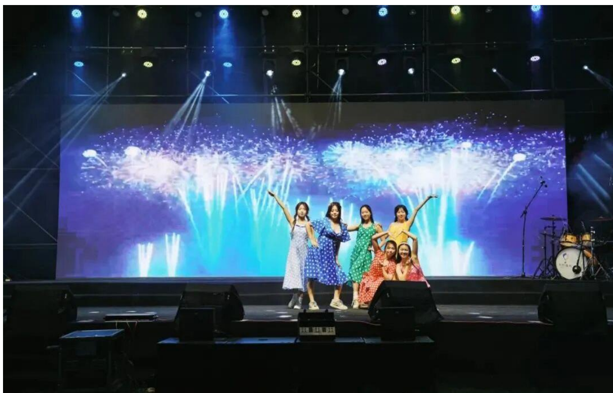
图 3-4 2025 年“青潮澎湃 ‘郝’华正茂”文艺晚会