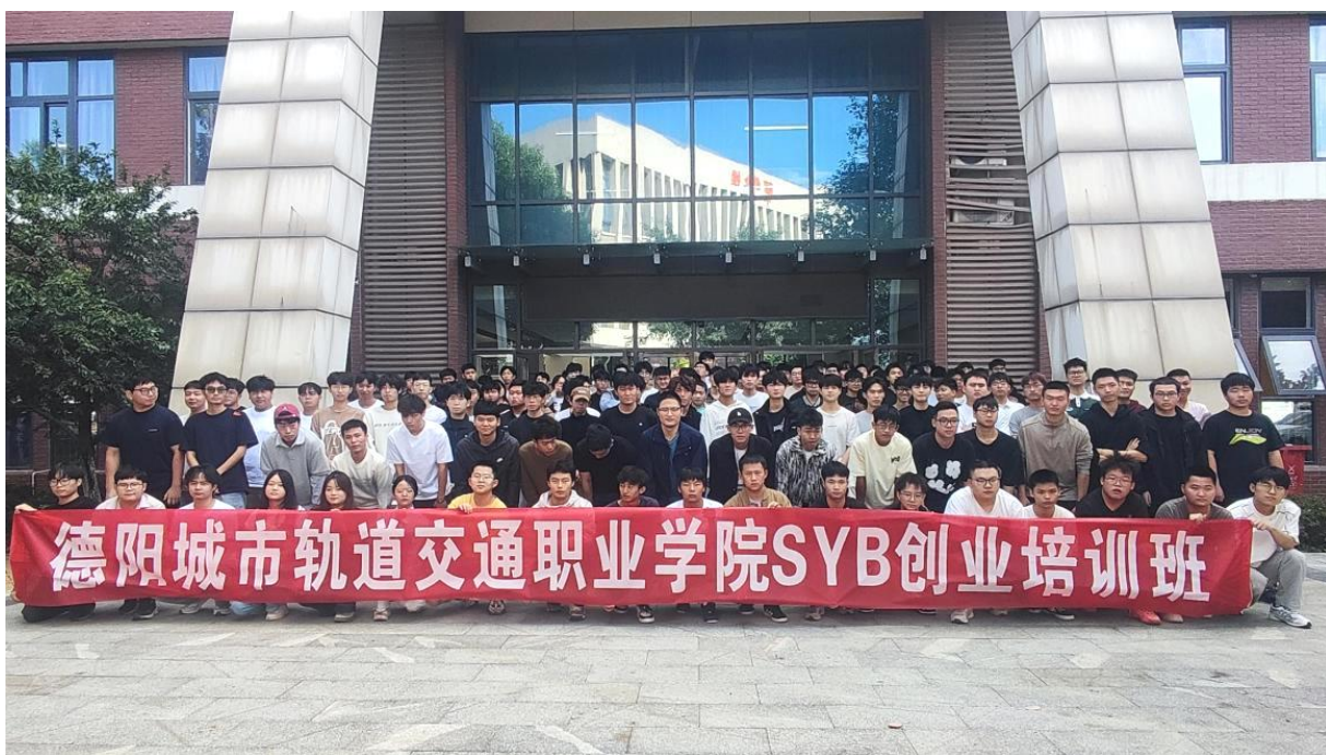
图 7-2 2025 年 11 月 SYB 创业培训开班仪式

培训工作组织有序、推进扎实，得到了应届毕业生的积极响应与广泛参与。通过系统学习与实践演练，学员们普遍提升了求职竞争力与创新创业意识，掌握了更为清晰的职业发展路径与实务操作技能。此次合作不仅是校政联动促就业的一次成功实践，也为学校深化教育教学改革、增强人才培养的社会适应性提供了宝贵经验