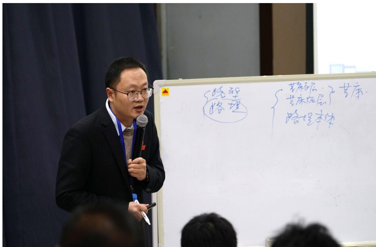
图 4-4 第七届教师教学能力大赛