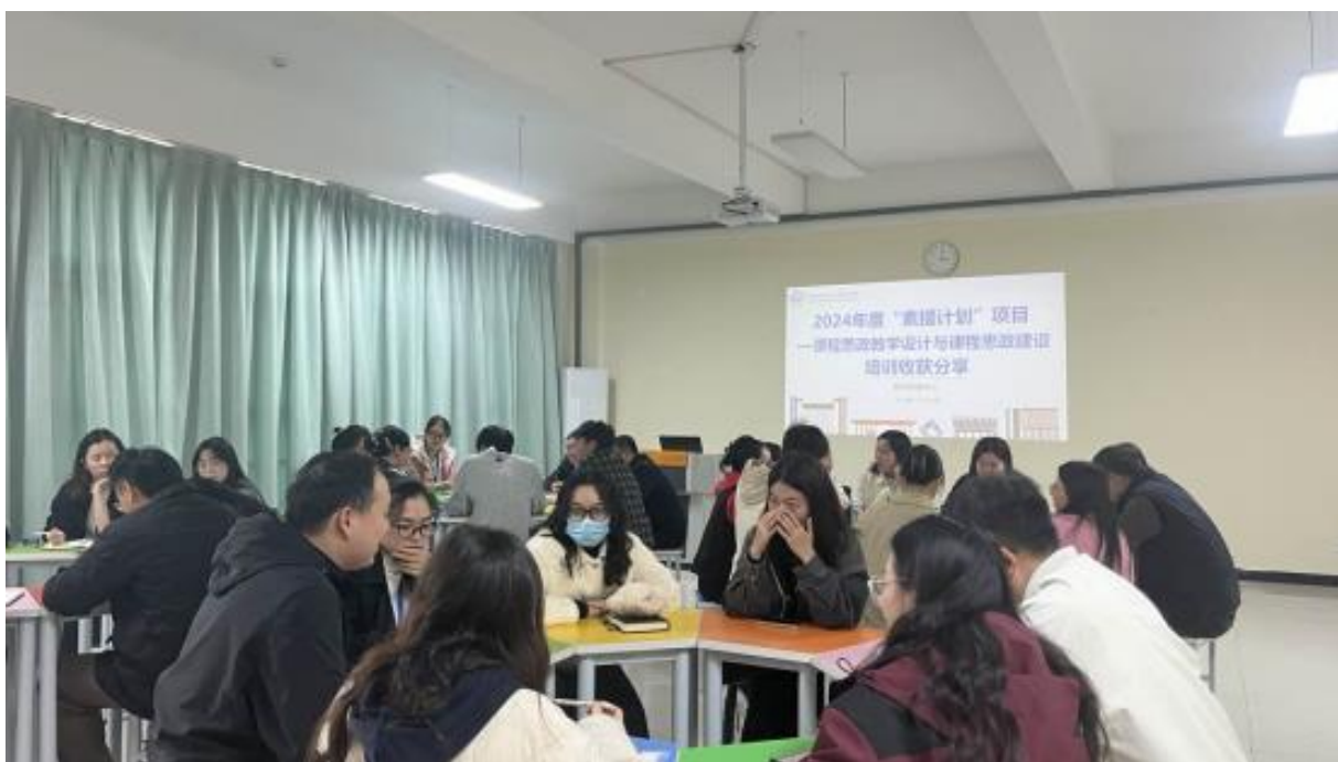
图 4-2 学校开展 2024 年度培训收获分享活动

历时七周的系列分享，既展示了我校教师的培训成果，也为教师搭建了互学互鉴、互促共进的交流平台，有效推动了师资队伍的整体发展。