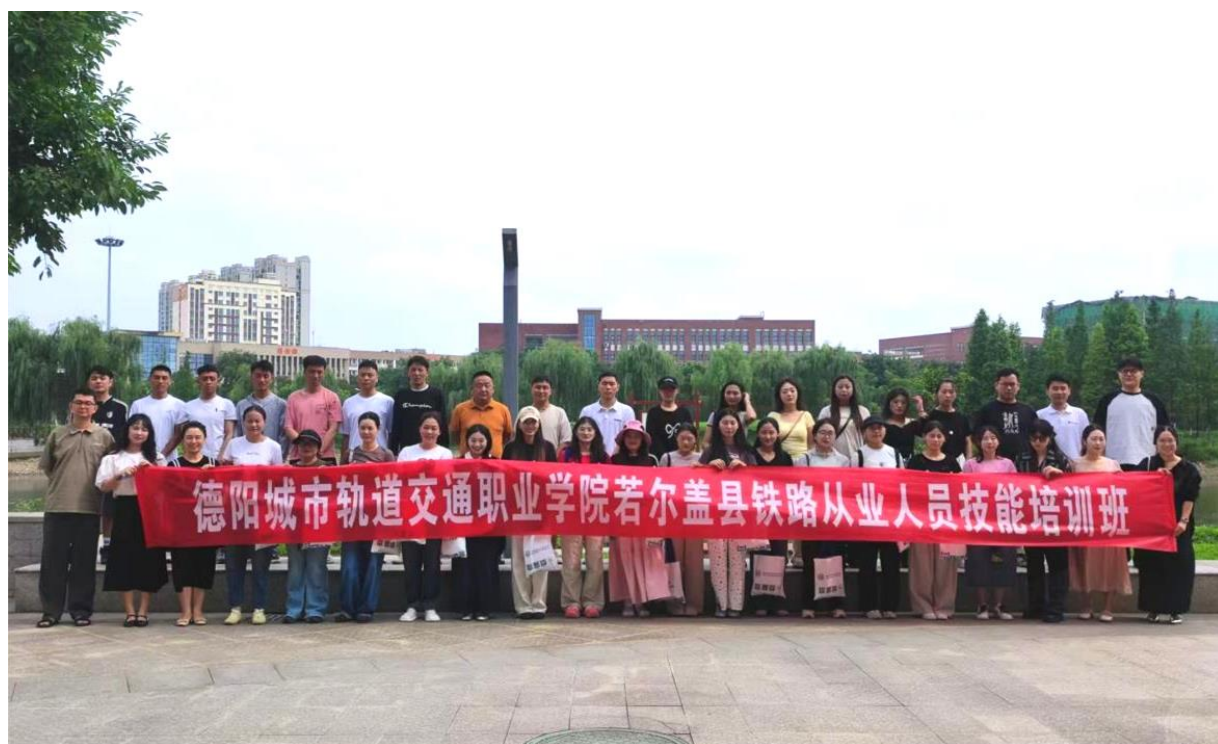
图 7-1 2025 年 7 月若尔盖铁路从业人员开班仪式

此次项目的圆满成功，标志着学校社会培训工作打开了新局面，探索出了一条“精准帮扶、技能赋能、就业直达”的特色路径。未来，学校将以此为契机，继续深化社会培训服务体系，拓展合作领域，打造更多精品培训项目，为服务地方经济社会发展、助力更多群体实现技能成才与稳定就业，持续贡献智慧与力量。