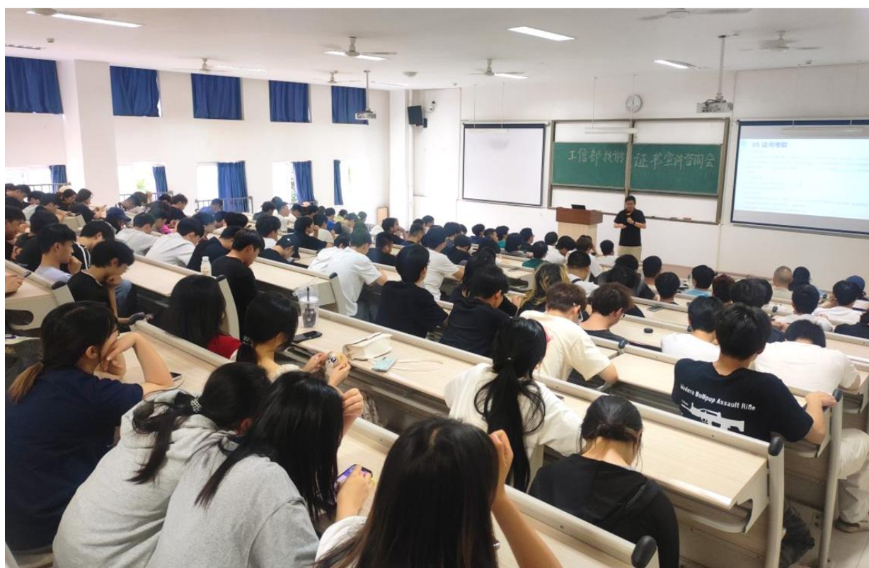
图 3-13 2025 年 6 月 “PLC 技术应用” 证书培训现场

展望未来，学校将持续完善“双证书”工作的长效机制，紧跟产业升级与行业标准变化，不断更新证书目录，优化支持服务，努力让每一位学生都能手握扎实的学历凭证和过硬的技能证明，自信迈向职场，赢得美好未来。