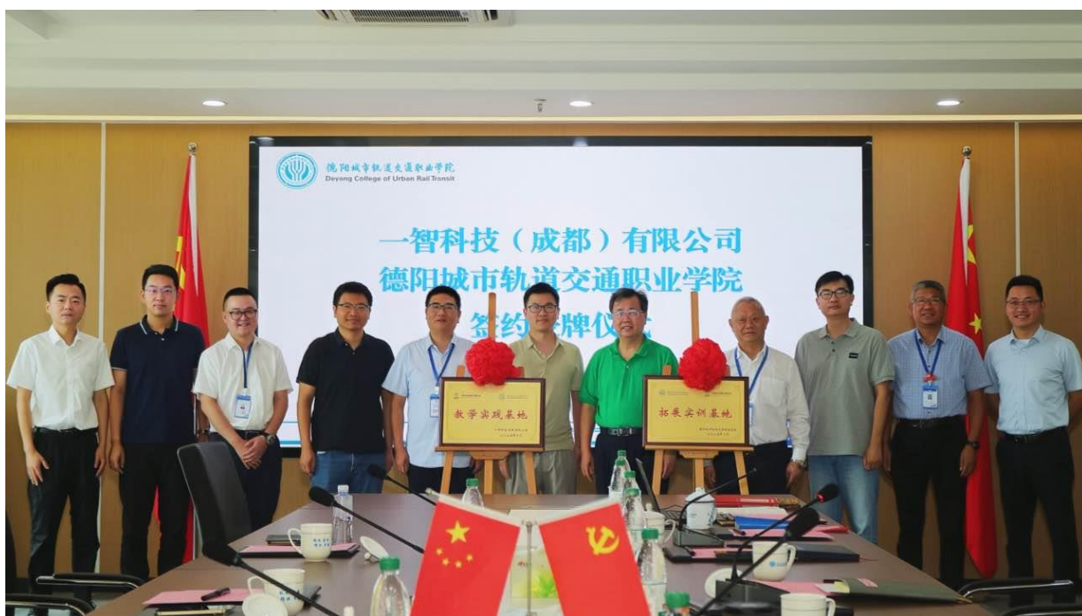
图 8-1 与一智科技（成都）有限公司举行战略合作协议签约暨授牌仪式

一系列创新实践不仅丰富了产教融合的内涵与形式，更显著提升了学校的人才培养质量与社会服务能力，得到了合作企业与行业主管部门的高度认可。未来，学校将持续深化产教融合体制机制改革，进一步强化校企协同在人才培养、技术研发与社会服务中的核心作用，不断拓展合作广度、挖掘合作深度、提升合作效度。通过完善校企协同育人长效机制、共建产业学院、联合开展技术攻关等举措，持续优化人才培养体系，着力培养更多适应产业发展需求的高素质技术技能人才，为区域经济高质量发展提供更加坚实的人才支撑与智力保障。