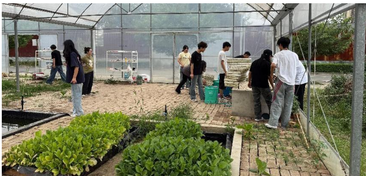
图 7-5 组织学生清理烟草大棚

一系列举措协同发力，使劳动教育从理念走向行动、从课堂延伸到生活，切实为培养德技并修、兼具劳动素养与职业能力的新时代技能人才筑牢根基。