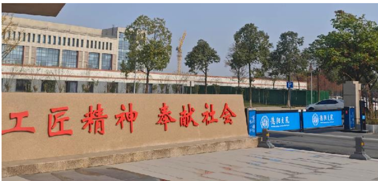
图 1-5 学校南大门车辆道闸系统