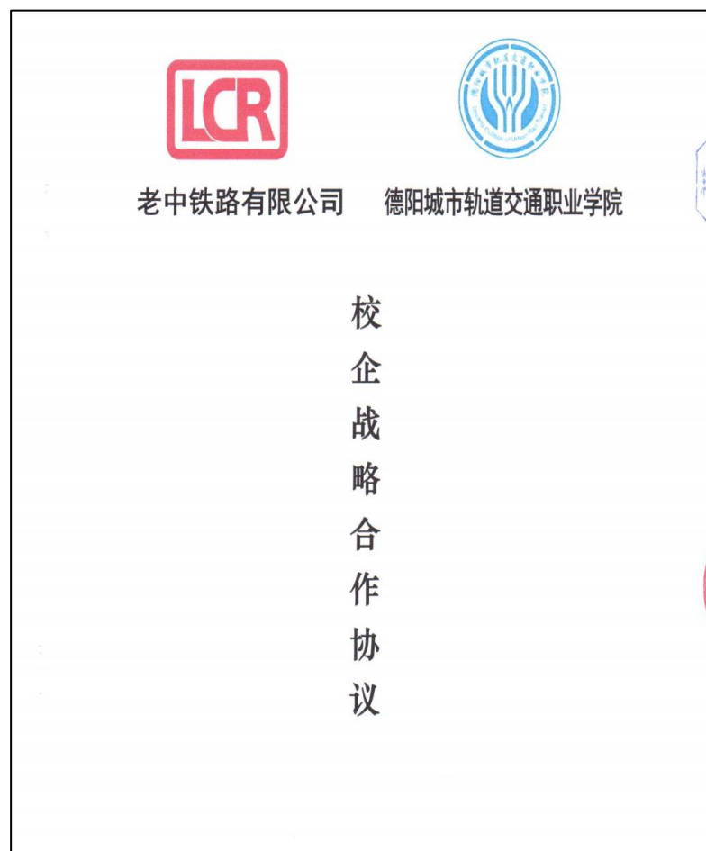
6-2 学校与老中铁路有限公司校企战略合作协议