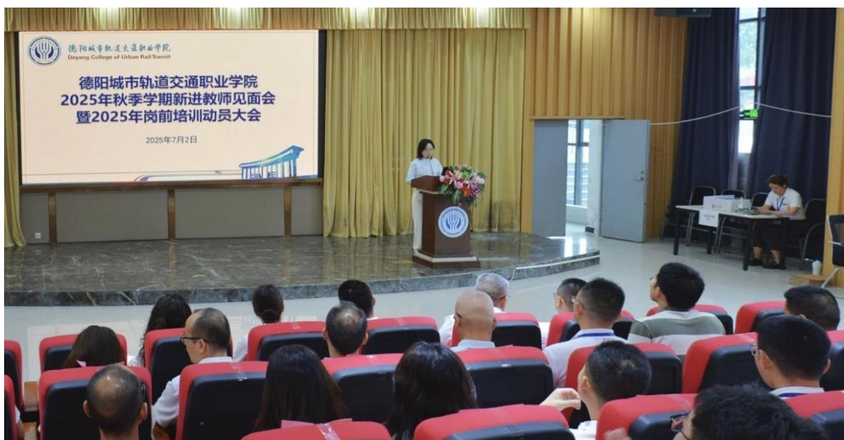
图 4-1 学校开展 2025 年新入职教师岗前培训动员大会