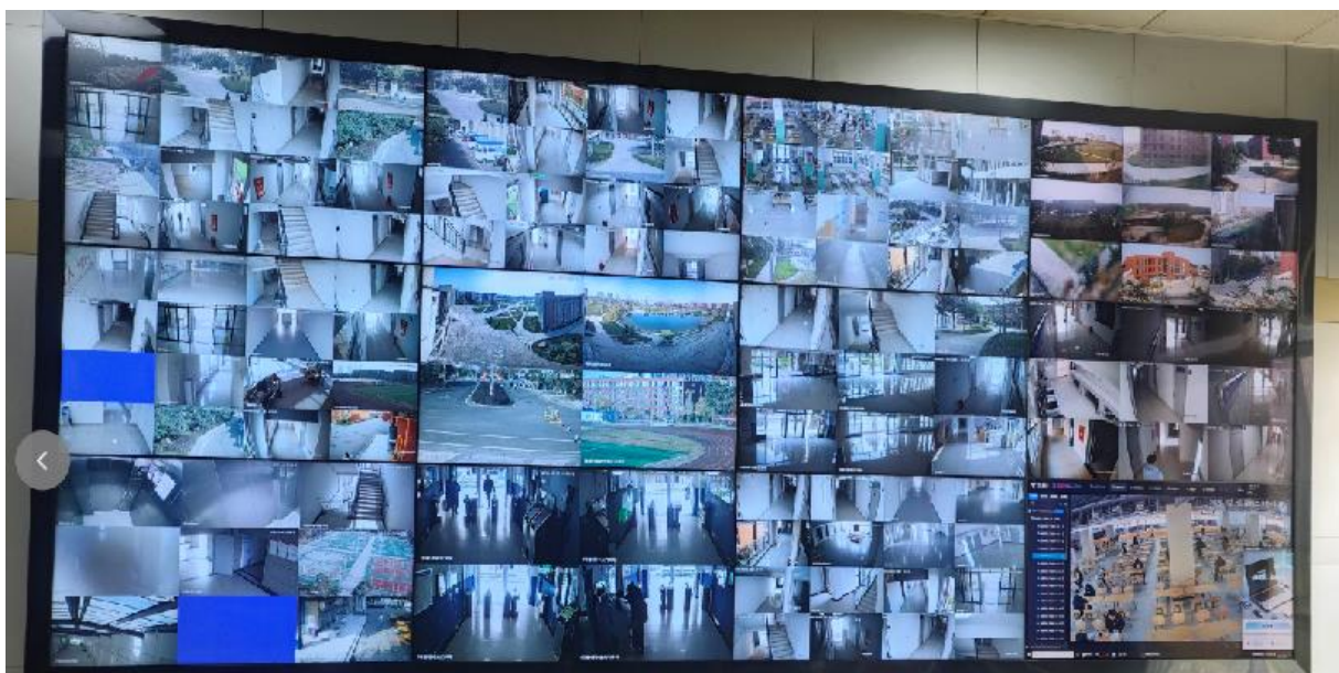
图 1-3 学校视频监控平台