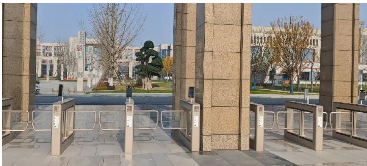
图 1-4 学校南大门人脸识别系统

学校西北门、南大门新增人脸识别系统，南大门新增车辆道闸系统，同时集成了学生请假、访客管理等功能模块。对比之前的刷卡进校，这一举措不仅提升了系统的性能和安全性，还为师生带来了更加便捷和高效的体验。