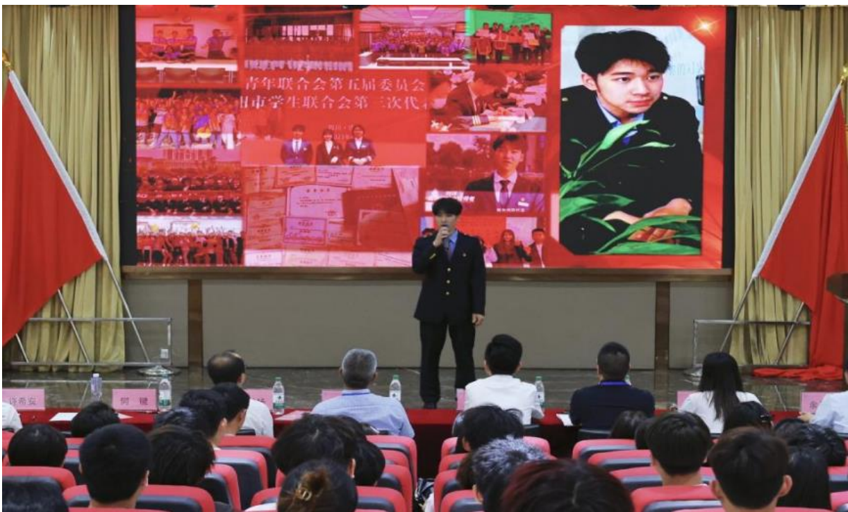
图 3-8 2025 年“红心向党·助燃青春”主题演讲比赛