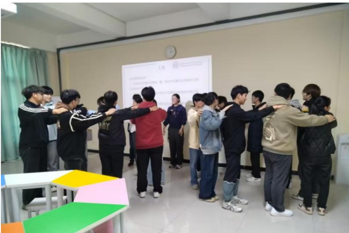
图 3-1 开展团体心理辅导