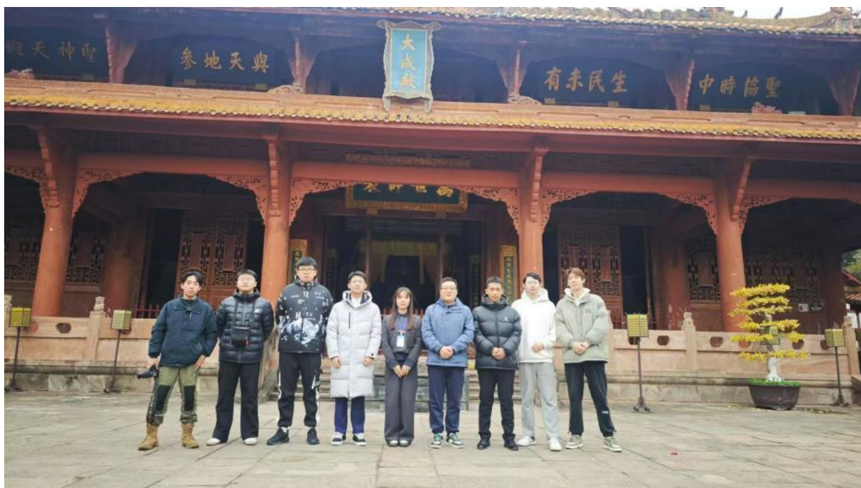
图 7-3 绘制德阳文庙游览图实地考察