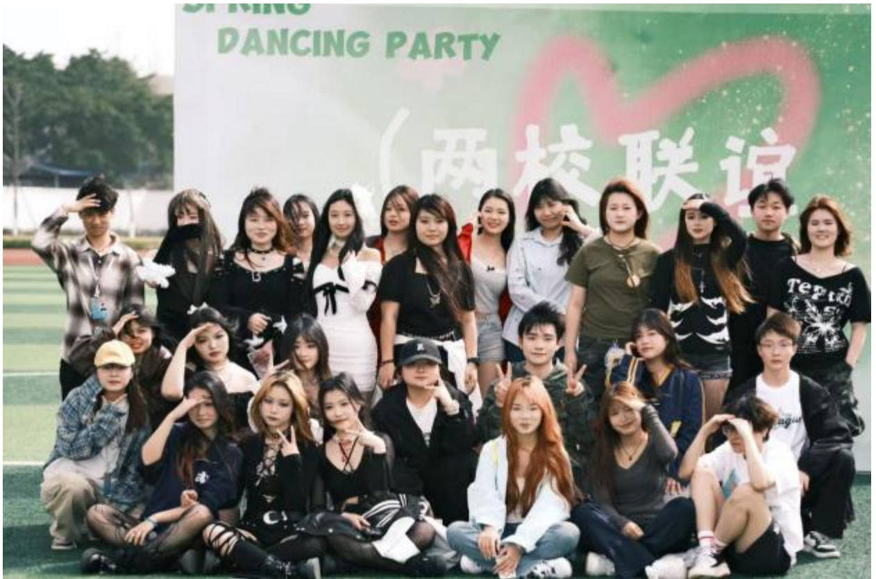
图 2-3 2025 年“春日舞会”联谊活动

学校将学生社团作为复合式人才培养的重要平台，在校学生社团 42 个，涵盖思想政治、文艺体育、沟通交流、学术科技类等社团组织。2024-2025 学年社团开展活动 1907 余次，活动范围及参加人数达 4.8 万余人。